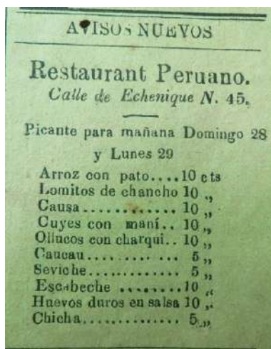
Foto 7. Publicidad del restaurante Peruano, en El Imparcial , 27 de junio de 1896.