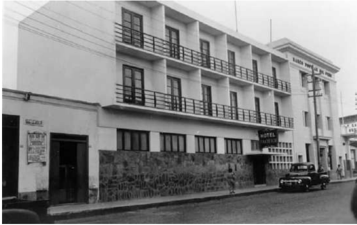
Foto 5. Fachada del hotel Pacífico en la década de 1950. Colección personal del autor.