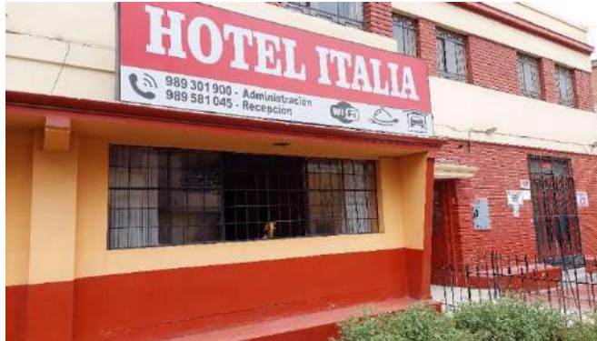
Foto 1. Vista actual del Hotel Italia, el hotel con mayor número de habitaciones en la ciudad de Huacho.