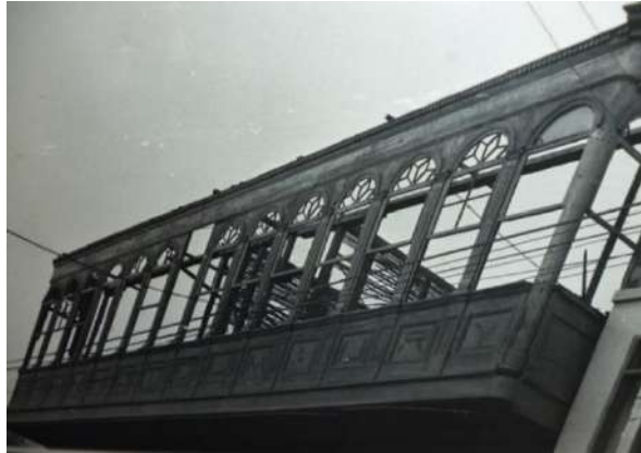
Foto 3. Foto donde se observa el balcón del Hotel Maury ya desmantelado, pero con el anuncio del hospedaje.