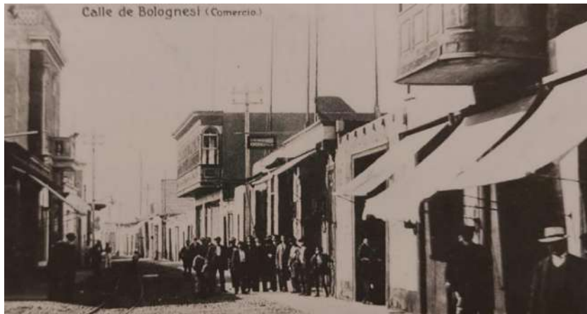
Foto 2. Postal en donde se observa el balcón del Hotel Maury, en ese tiempo en la calle Comercio, llamada ahora calle Francisco Bolognesi.