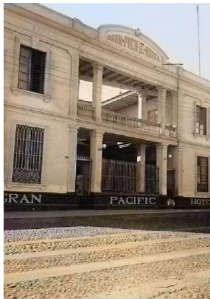
Foto 4. Vista del frontis del Hotel Pacífico a inicios del siglo XX.